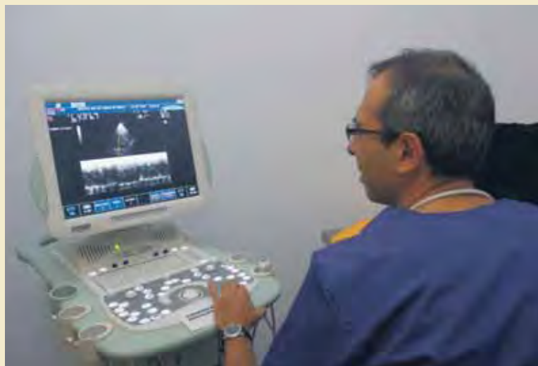
Profesionales con acreditada experiencia forman la plantilla del Hospital de Urgencias.

Esta iniciativa viene a responder a una demanda que estaba presente en la sociedad murciana. "El propietario de una mascota debe valorar que su 'mejor amigo' va a ser siempre atendido por un profesional con años de experiencia y dedicación exclusiva a la medicina veterinaria directamente con el público", señala el coordinador del Hos-