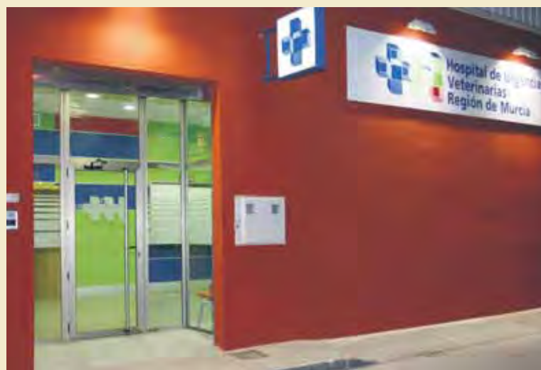
Fachada del centro, situado en la avenida Juan de Borbón, de Murcia.

de salud de la mascota desde que es atendido por una emergencia, hasta que su veterinario habitual pueda hacerse cargo del seguimiento del caso; es decir, atendemos, aplicamos los tratamientos adecuados y mantenemos hospitalizados a los ani-