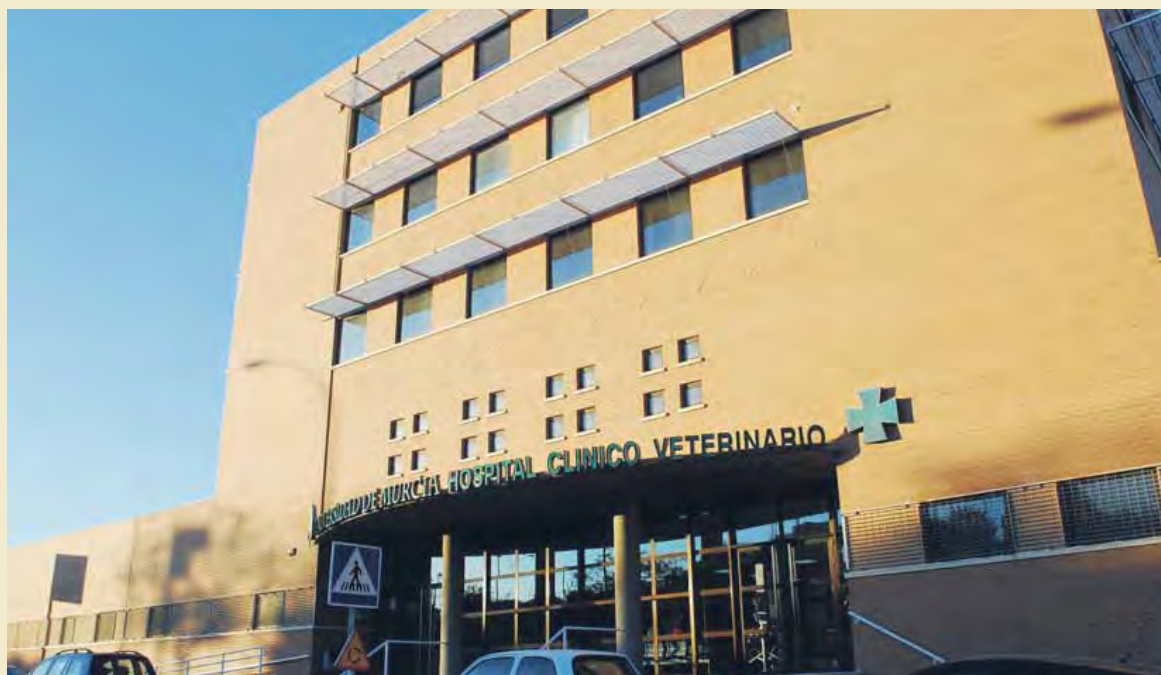
El Hospital Clínico Veterinario de la Universidad de Murcia está situado en el Campus de Espinardo, junto a la Facultad de Veterinaria.

Todas las especialidades veterinarias tienen cabida en el hospital clínico adscrito a la Facul-