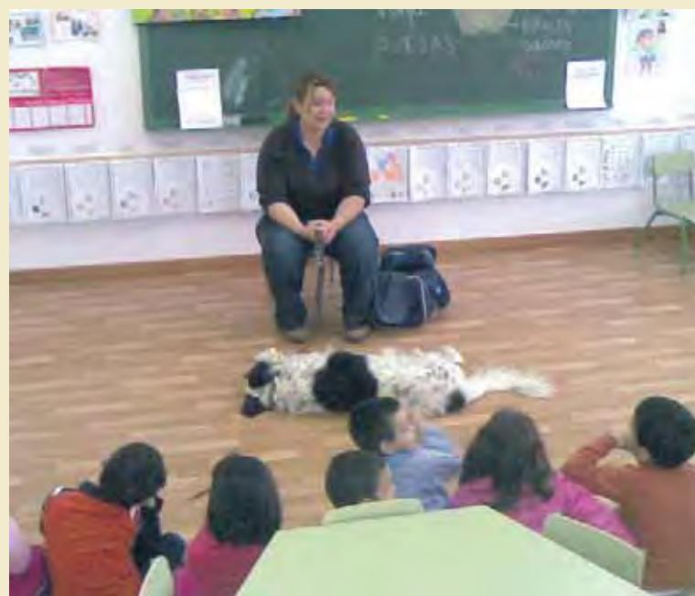
Los responsables de Animal Hotel enseñan a los escolares a tratar a los perros.

"Tratamos de que los niños tengan más información sobre los perros, cómo actúan, cómo distinguir a un perro agresivo