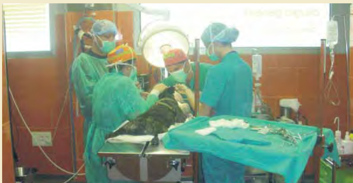
El Hospital Veterinario La Flota dispone de unos amplios y modernos quirófanos como se aprecia en la imagen.

La cirugía es un procedimiento sencillo y la mejoría clínica es muy rápida y evidente. Los pro-