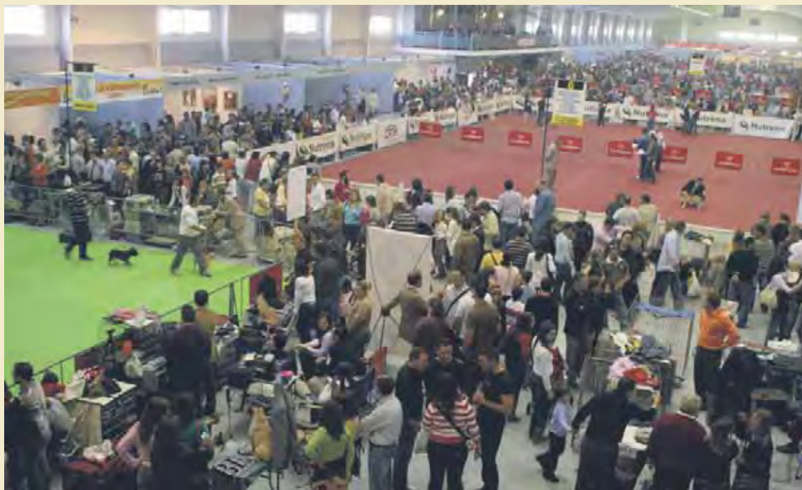
Aspecto que presentaba el año pasado el recinto ferial durante la anterior exposición canina celebrada en Torre Pacheco.

Durante todo el fin de semana se desarrollan exhibiciones, como la del perro ratonero bodeguero andaluz, la del grupo de perros de agua español, del Ser-