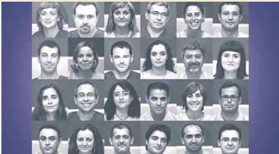
Veterinarios directores de diversas clínicas gestionan y atienden en el Hospital de Urgencias Veterinarias de la Región.